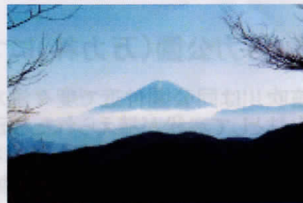
⑨ダイヤモンド富士で賑わう