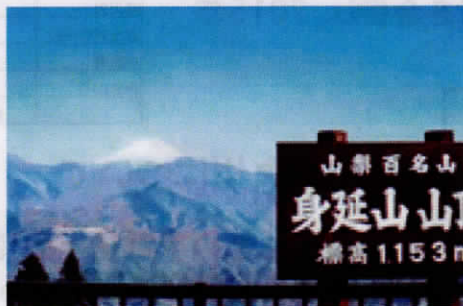
②3月例会を行った場所です。