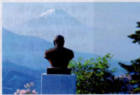
⑤銅像はポールラッシュ博士