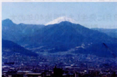
④まさに今いる場所