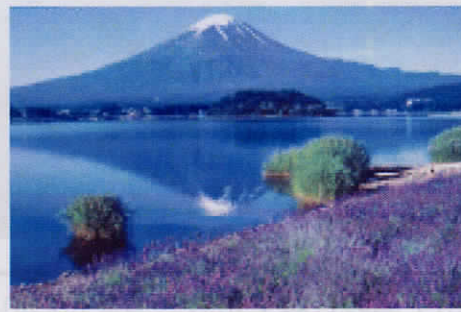
⑥ラベンダー畑で有名