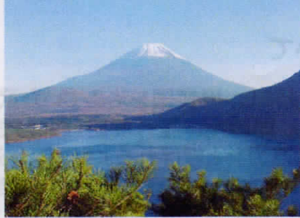
⑧1000円札の裏を見てみて!!